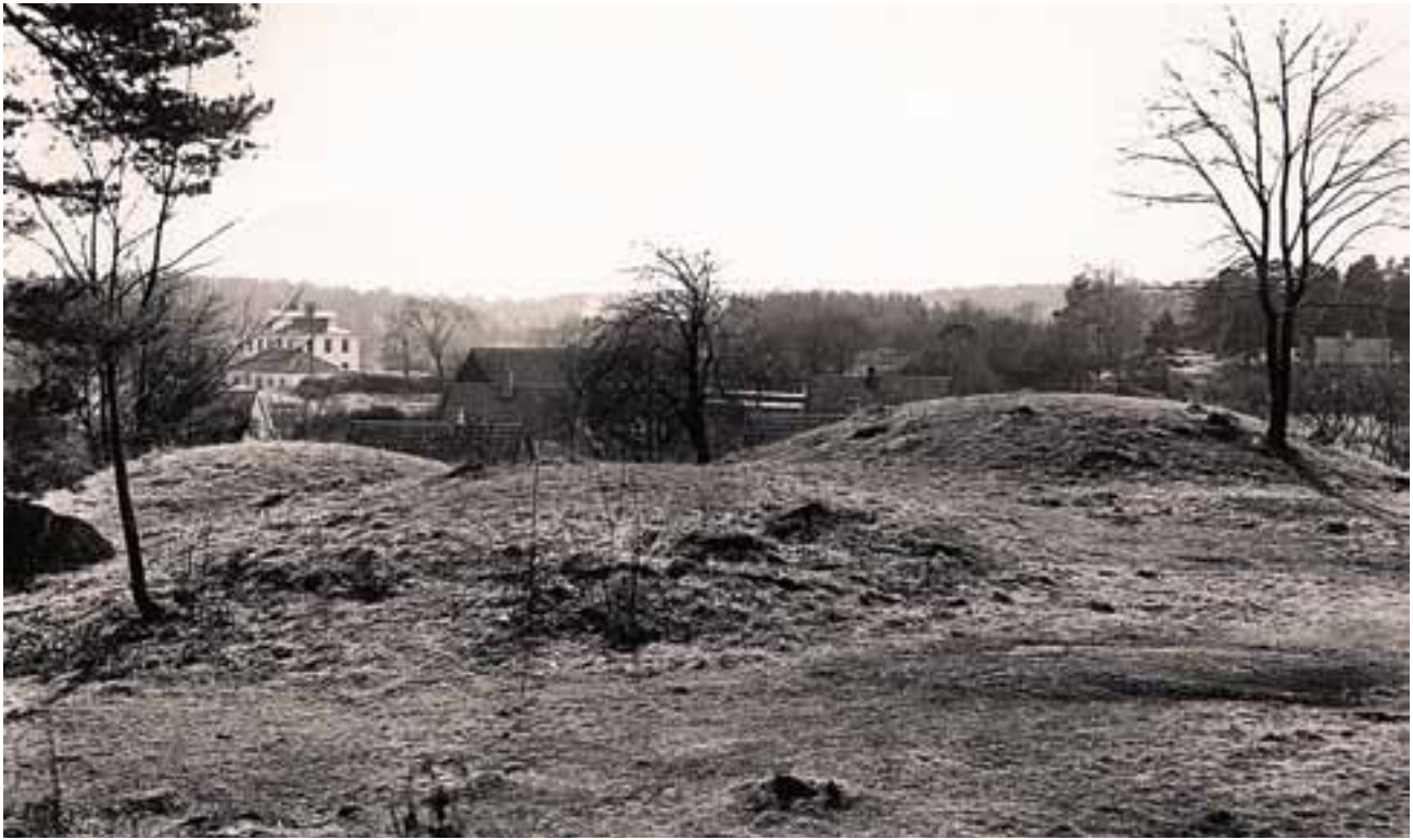
En gammal bild av Komötet.

ett brandlager, skärvor av ett lerkärl och några järnspikar.