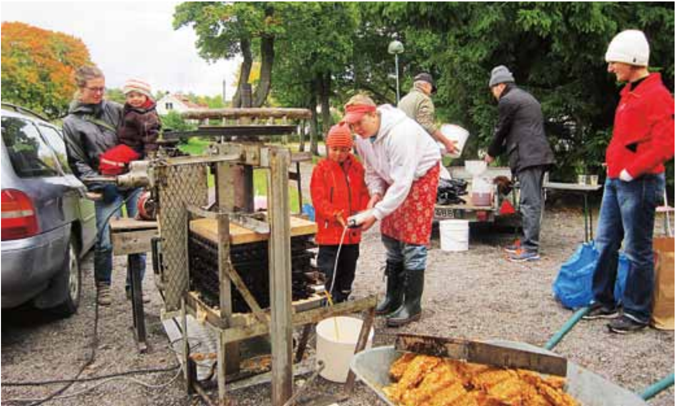
Äppelsöndagen hölls som vanligt på slottet i månadsskiftet september-oktober.

på hemsidan. Året blev efter en lugn inledning tyvärr mycket påfrestande för många på grund av inbrott i husen och stöld av cyklar. Inte mindre än 50 cyklar har stulits i området under året. Vår ambition är att söka minska den tendens som finns bl a genom att stödja Grannsamverkan.