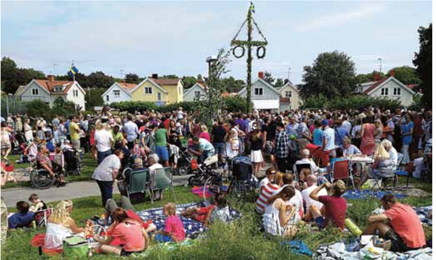
Midsommarfirandet i Björklunds hage var mycket välbesökt.