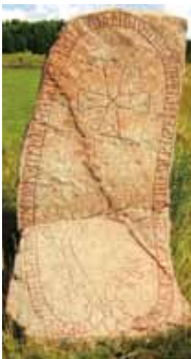
Runstenen U965 i Uppland signerades av den kände runmästaren Asmund Kareson.

Asmund hade en personlig, elegant, runristarstil, vilket är förklaringen till att osignerade stenar kan tillskrivas honom.