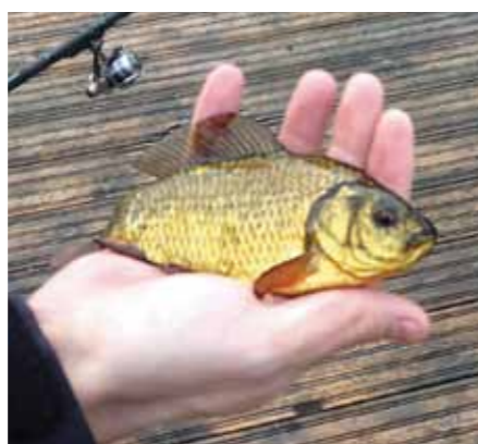
Rudan kan klara helt syrefria förhållanden under vintermånaderna genom att gå i dvala.

Rudor är inget man äter. De återbördas till sjön eller används som bete vid till exempel gäddfiske. Men i Kyrksjön finns numera inga gäddor, abborrar eller annan insjöfisk. Övergödning och syrebrist har tagit kål på de vanligaste fiskarna, förutom rudorna som har en säregen förmåga