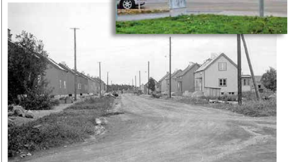
Beckombergavägen sedd från Bällstavägen. Bilden är tagen den 29 augusti 1932 när Norra Ängby växte fram. Den övre bilden från samma plats den 27 november 2014.

Detta om själva namnet. Nu till funktionen! Beckombergavägen är idag Norra