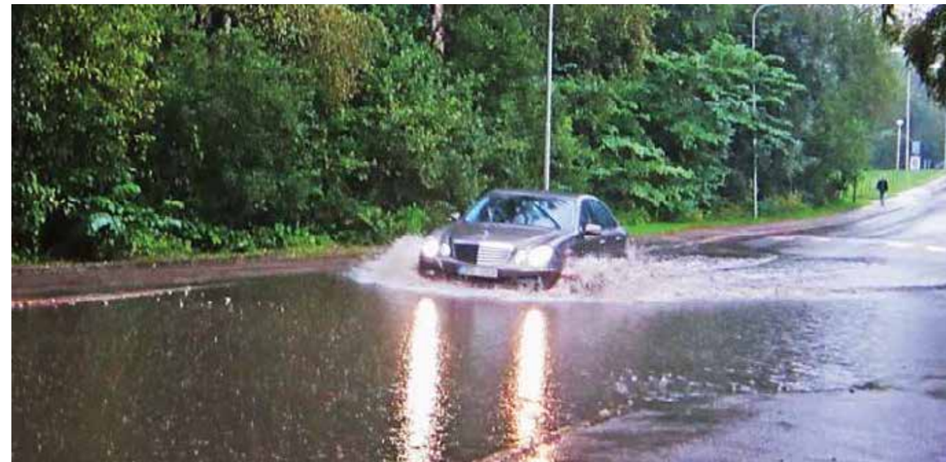
Vid kraftiga regn under sommaren vattenfylls den lägsta delen av Vultejuvägen. Huvudorsakerna är dels sättningar i gatan på lägsta punkten, dels den dåliga eller obefintliga avrinningen via den Ljunglöfska kanalen till Räcksta träsk.