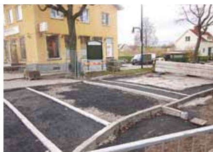
De nya fartguppen ska göra det säkrare för skolbarnen att ta sig över vid torget mot skolan.

På Vultejusvägen mot skolan har man just satt igång med att utföra de