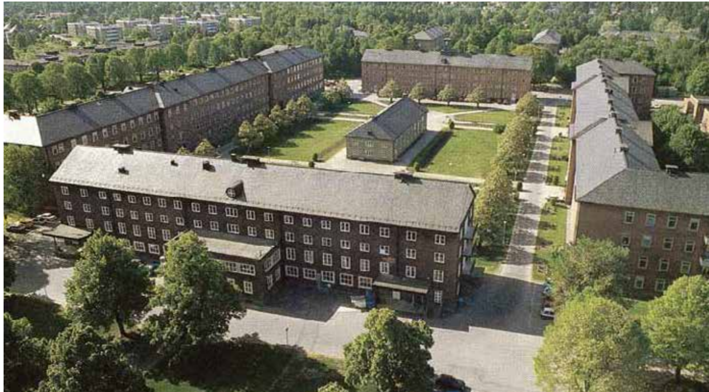
"Beckis" sett från Spångasidan. Bilden är ur en minnesbok från 1990-talet om sjukhuset långt innan den stora omgörningen av Beckomberga till fint bostadsområde hade påbörjats.