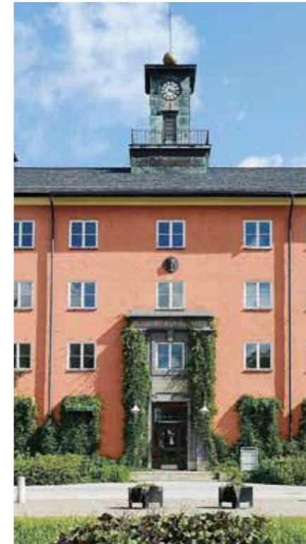
Och så här ser vi entrén och klocktornet från Norra Ängby-sidan.

Vården var fram till 40-talet närmast en förvaring där tvångsmedel i form av t ex bältesläggning måste tas till för att skydda patient och personal. De antipsykotiska läkemedel som då introducerades revolutionerade vården. Lika stor betydelse hade förmodligen den vårdfilosofi som