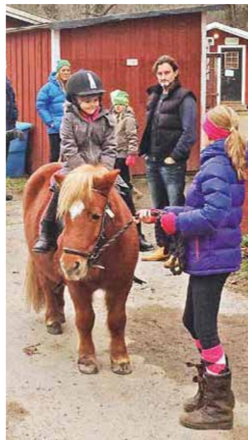
Tio tjejer arbetar frivilligt och två vuxna är anställda på deltid med ansvar för verksamheten på 4H i Björklunds hage.