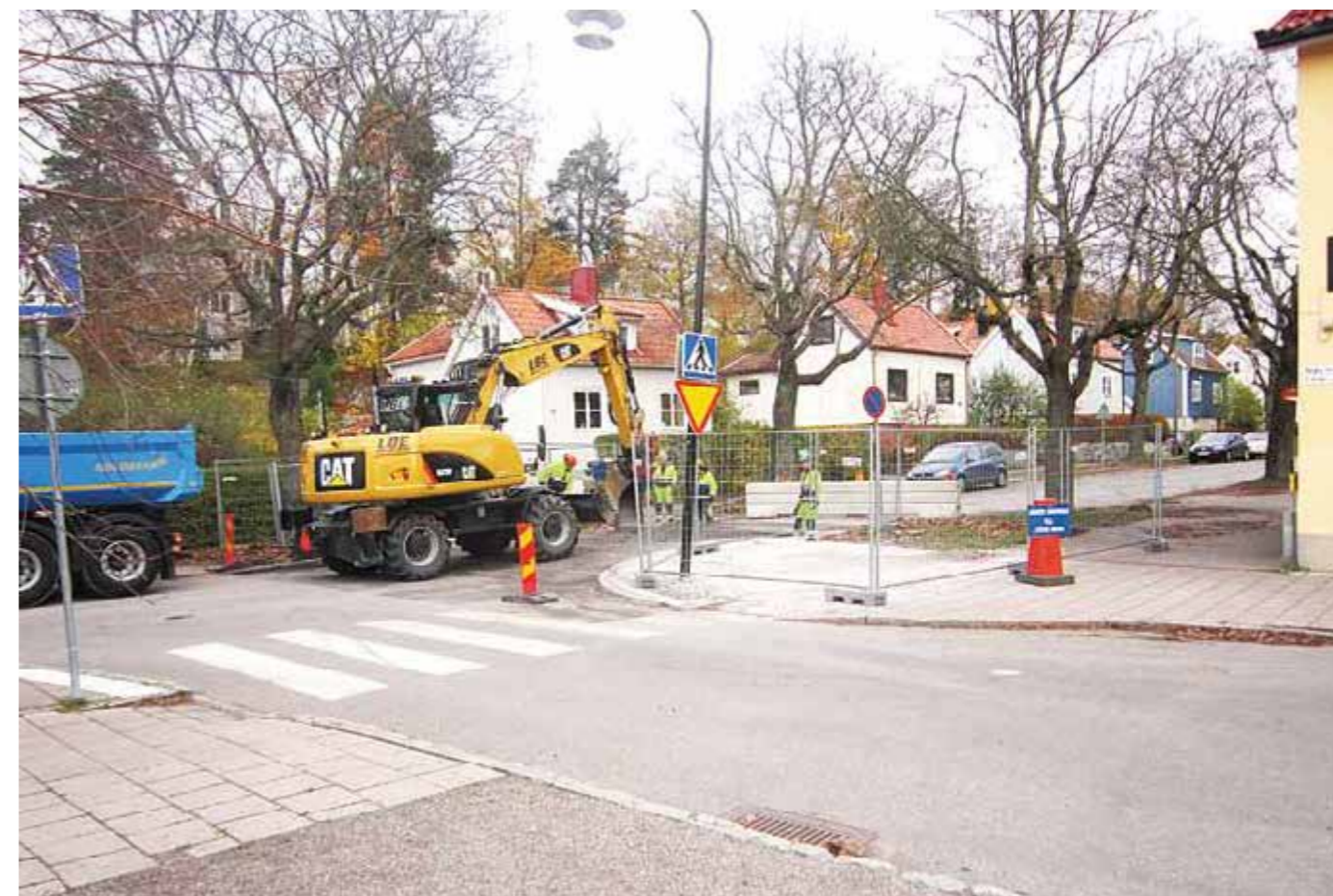
Höstens arbete för att göra skolvägen säkrare innebar bland annat att Beckombergavägen stängdes av vid torget för genomfart vilket medförde minskad trafik på Beckombergavägen. Istället ökade trafiken på en del av smågatorna i närheten.

styret lossnade (!). Inte ovanligt var att en skolväska eller plastpåse, som hängt över styret åkt in i framhjulet. I en fjärdedel av singelolyckorna kunde man inte finna någon påtaglig yttre orsak, vilket tolkades som oförmåga att hantera cykeln; barnet var helt enkelt inte färdigutvecklat för att klara av att framföra en cykel i trafik.