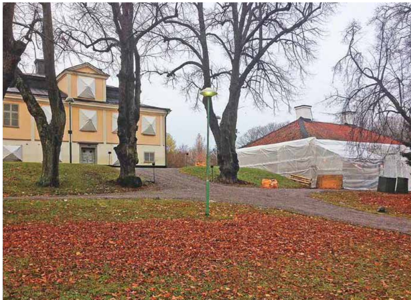
Ångby slott är nu helt tomt på möbler och annat lösöre. Ännu finns ingen ny hyresgäst men det pågår ändå verksamhet vid slottet. Fastighetsförvaltaren Stadsholmen har påbörjat den yttre renoveringen.