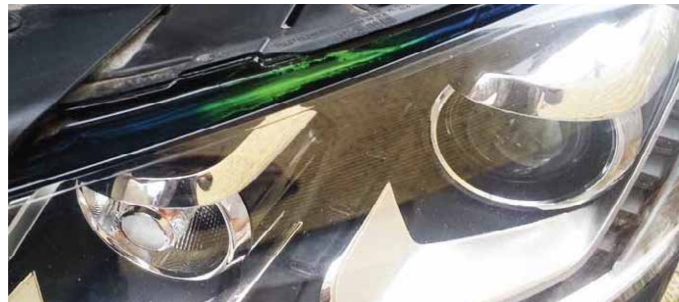
Strålkastare, krockkuddar och instrumentpaneler – de komponenter som är mest utsatta – kan märkas!