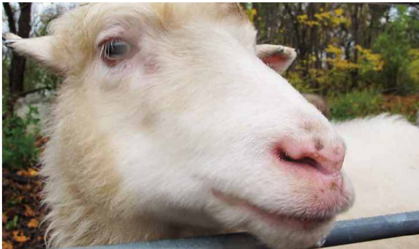
Av alla djuren i Björklunds hage verkar fåren, och de små lammen, locka barnen mest. De blir gärna klappade men besökare ska inte mata djuren.