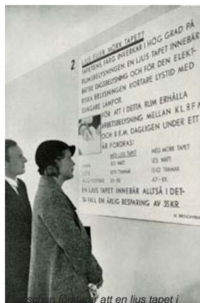
En sådan förklaring att en ljus tapet i rummet ger en årlig besparing på 35 kronor, eftersom belysningen inte behöver vara tänd lika länge som i ett rum med en mörkare tapet.

Efter 15 omöblerade rum introducerades en ny variabel: möbelen, och därefter presenterades relationen mellan tapeter och möbler. Några rum senare återkom motsatsparen i form av två likadant möblerade rum, men med olika kulörställningar, en i harmoni och en i disharmoni.