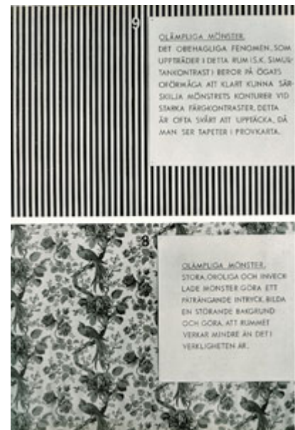
Två exempel på "olämpliga mönster". Budskapet var att stark färgkontrast, som i den randiga tapeten, och oroliga och invecklade mönster som i den blommiga tapeten, borde undvikas.