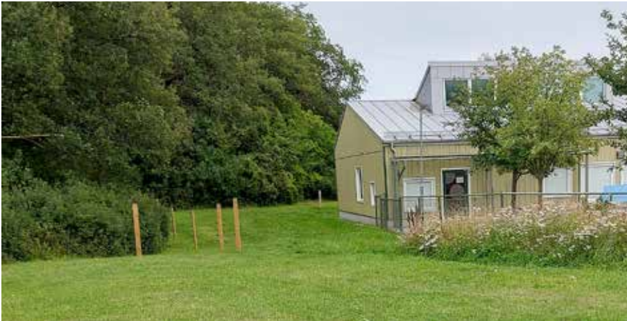
Barnen på förskolan kommer att få se kor och får beta på nära håll.