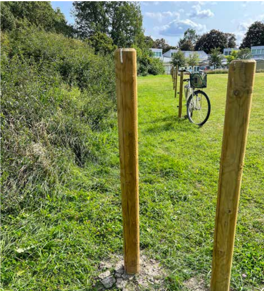
Vid Snorreängen leder stolparna upp mot förskolan och in i skogen, fortsätter mot Möjbrovägen och sedan tillbaka längs gångstigen.