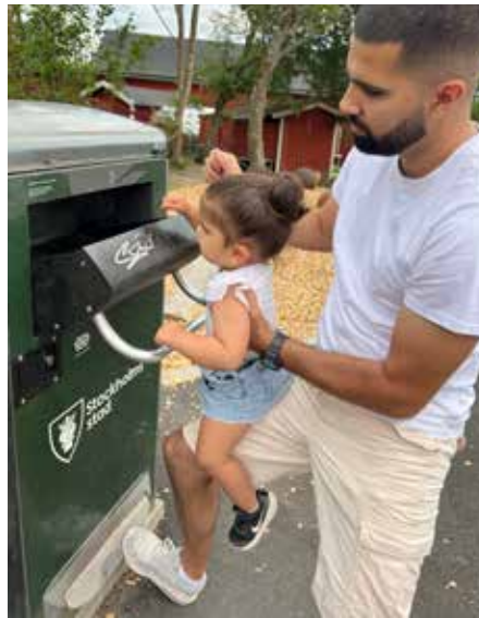
När luckan öppnas händer det magiska: soptunnan smaskar och säger tack.

I parken finns tre rutschkanor: en tubrutschkana för de större barnen, en för de mindre och en för de riktigt små. För att ta sig upp till den största rutschkanan