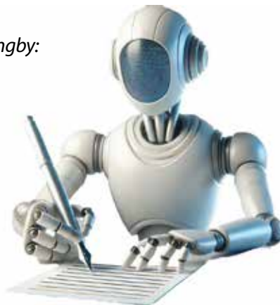
Språkroboten Chat GPT-4 har skrivit den här artikeln och skapat illustrationerna.

Norra Ängby började utvecklas som ett bostadsområde på 1930-talet som en del av Stockholms stads trädgårdsstads-satsning. Målet var att skapa en balans mellan stadsliv och natur, där invånarna