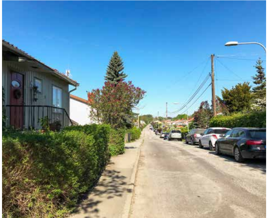
Tegnebyvägen går mellan Vultejusvägen och Egilsvägen.

Aspeberget i Tegneby har en mycket intressant hällristning. På en brant, mot norr sluttande bergssluttning finns en stor ristningsyta. På denna sluttning kan skönjas djupt inhuggna bilder av många små skepp, långbenta män med högt lyfta yxor,