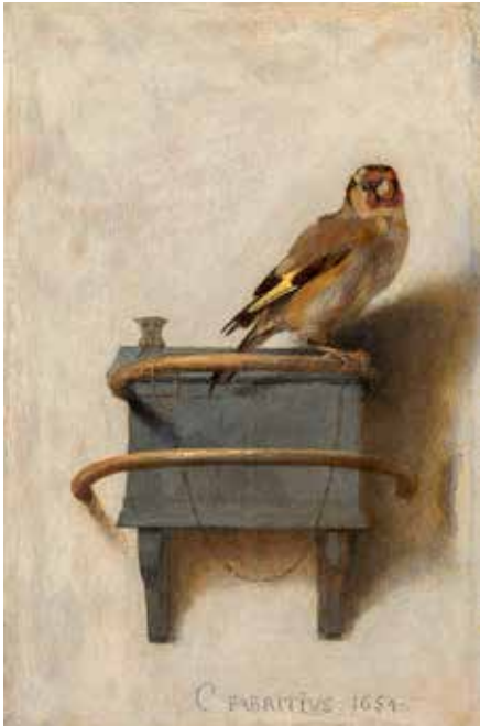
"The Goldfinch" (Steglitsan) av Carel Fabritius från 1654.