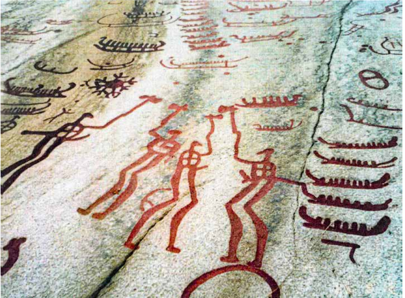
På Aspebergets sluttning i Tegneby kan bland annat skönjas djupt inhuggna bilder av många små skepp och långbenta män med högt lyfta yxor.

tade ur bronsålderns föreställningsvärld”. Båtarna visar den ”viktiga roll som sjöfart och handel fick under bronsåldern”.