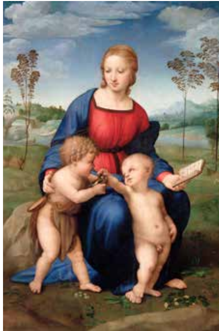
Rafaels verk Madonnan med steglitsen där Kristusbarnet håller i en steglits.