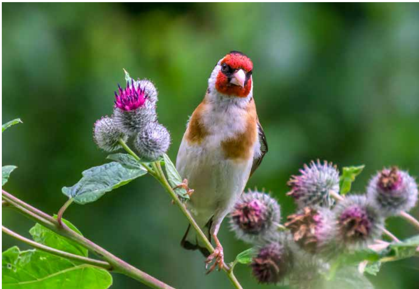
Steglitsen är ett populärt fotoobjekt runt Kyrksjön. Den här bilden tog Magnus Gerholm i mitten av augusti. Det är inte bara han och många andra fågelskådare som uppskattar den färggranna fina lilla finken. Steglitsens rika kulturella historia och symbolik sträcker sig över flera århundraden.

en steglits som ett varsel om hans framtida lidande. I målningen "Litta Madonna", från Leonardo da Vincis ateljé, syns en steglits vid Jungfru Marias hjärta.