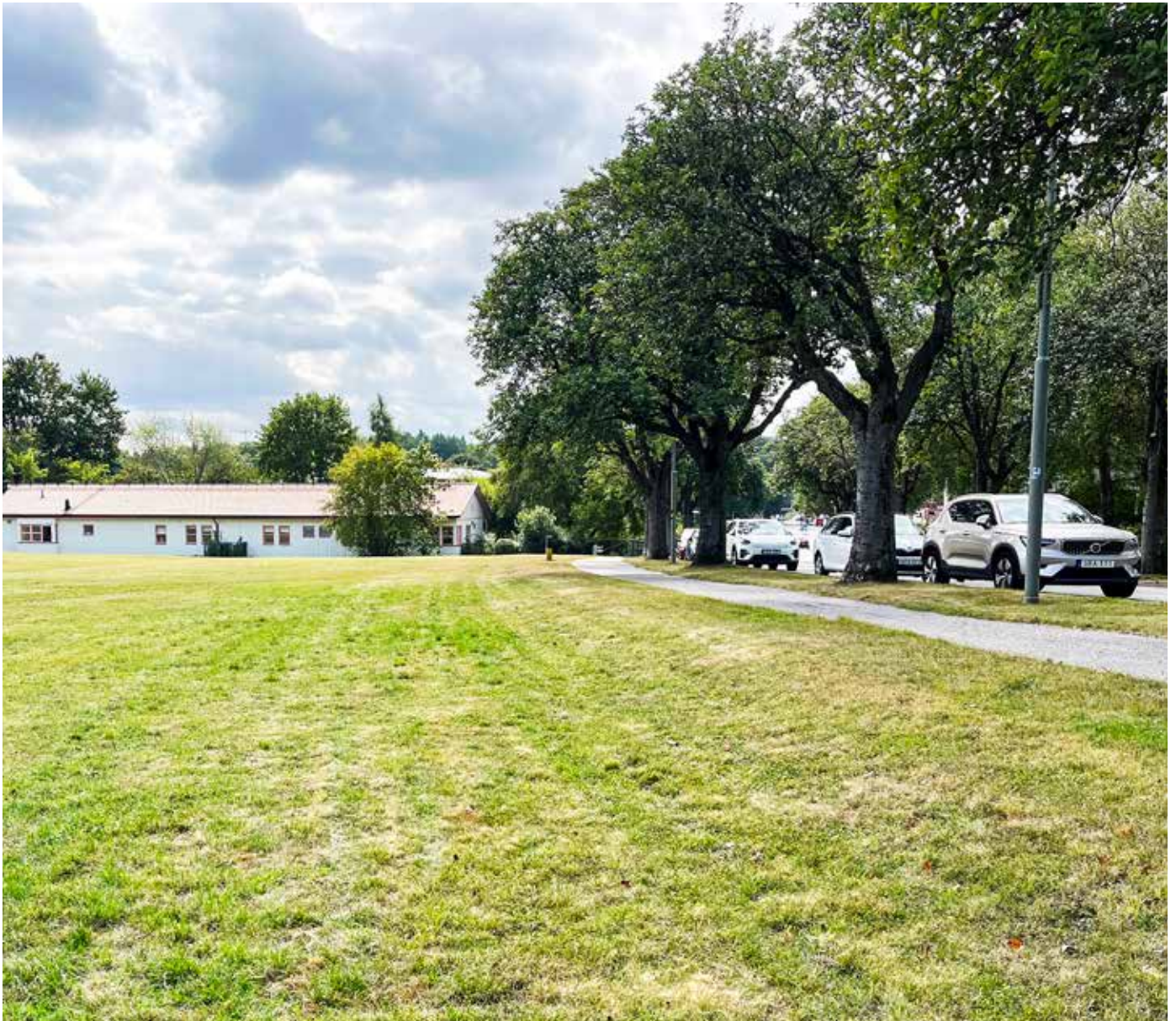
Det var här, längs Vultejusvägen, som den 60 meter långa skolpaviljongen skulle byggas. Nu har byggplanerna avbrutits.