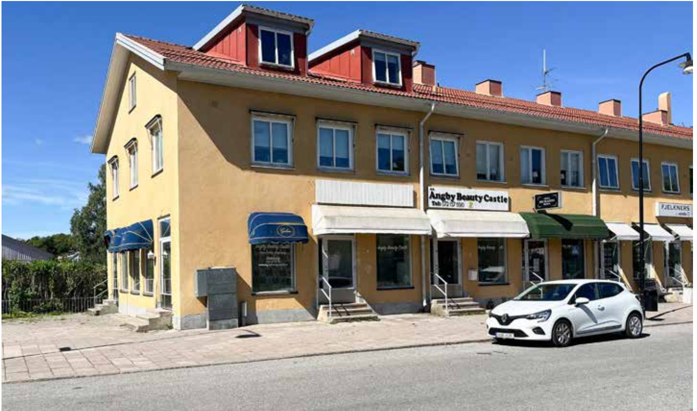
Ängby Beauty Castle har flyttat ut och nya verksamheter står redo att hyra hörnlokalerna vid Ängby torg.