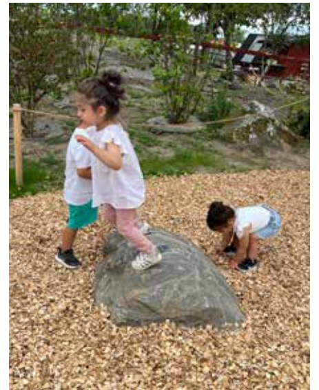
Marken är täckt av träflis så att även en treåring vågar hoppa.

Det finns gungor i olika storlekar, för både små och lite större barn. Dessutom finns det två stora korggungor i parken. Flickorna visar hur man kan gunga i den stora gungan trots att man bara är tre år, och att man i den stora korggungan kan gunga flera samtidigt.