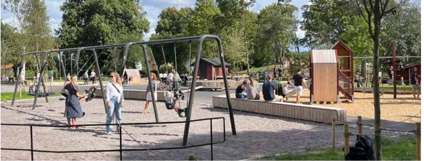
Den nya lekplatsen i Björklunds hage, som öppnades i början av juni, har varit välbesökt i sommar. Föräldrar och barn från hela Bromma har fyllt lekområdet samtidigt som övriga Norra Ängby har legat relativt sommarstilla.