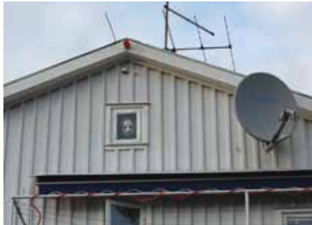
Liket på vinden?

Vad är nu detta? Detta är en riktig fråga till dig som läsare av vår fina tidning. I Ängbylunden står denna rostiga ställning. En »korg« nedtill och kedjor hängandes från en tvärså i toppen. Ett förslag var: frisbee-fångare! Uppe i skogen? Nä, är det ett foderbord för rådjur? Vem skulle i så fall ha