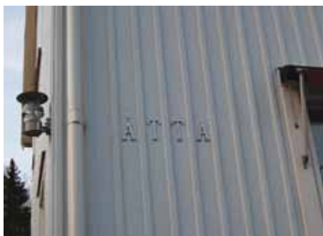
Åtta glas på död mans kista?