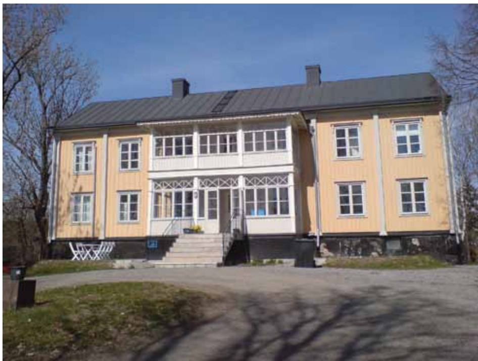
1780 lät Jonas Arnell uppföra den nuvarande mangårdsbyggnaden och de två flyglarna samt en vacker trädgårdsmästarvilla.

Ringstedt, N 2008: Bromma före historien