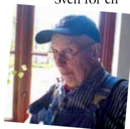
Sven för en

Vi har bokat en speciell visning av kvarnen tisdag den 16 juni. Det är ett bra tillfälle för en trevlig utflykt som ger en inblick i ett stycke teknik- och kulturhistoria i vår närhet.