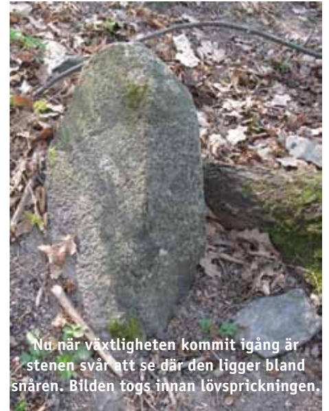
Nu när växtligheten kommit igång är stenen svår att se där den ligger bland snåren. Bilden togs innan lövsprickningen.

Inför de nu avslutade utgrävningarna i Karsvik strövade vi i västra delen för att få underlag för var vi själva ansåg att grävningar borde ske.