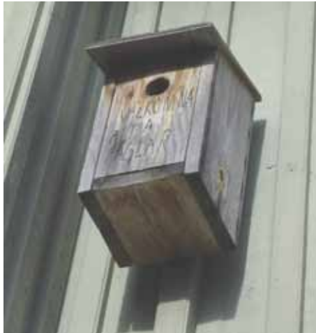
»Här vaktar Nisse!«

Med mycket mat, växer ungarna fort. Snart är de flygfärdiga och skall