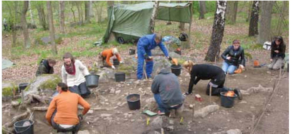
Förra årets utgrävningar vid platåhuset i Karsviks hage återupptogs i maj. En fullständig utgrävningsredovisning hittar du på www.norra-angby.se

I ett nytt schakt längre österut i platåhuset har ett spännande fynd gjorts. Det är ett vikingatida litet bryne av skiffer, ca sex cm långt, en cm brett och med flera slipytor, alltså uppenbart väl använt! Järnfragment har också påträffats. Intressant är den stenpack-