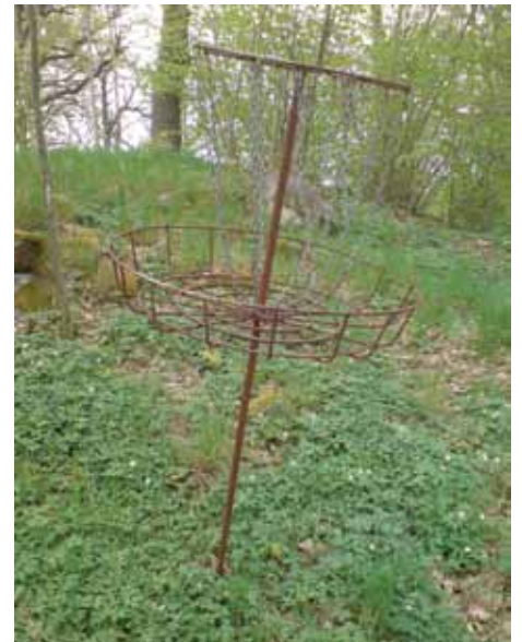
Vad kan detta vara som står uppe i Ängbylunden?

ställt upp det? Och när – under kriget när maten var knapp? I dessa dagar är det knappast någon här i området som skulle komma på tanken att mata dessa tulpanaknipsare! Så, gärna ett mail till nalle@remnelius.se • Pelle & Nalle