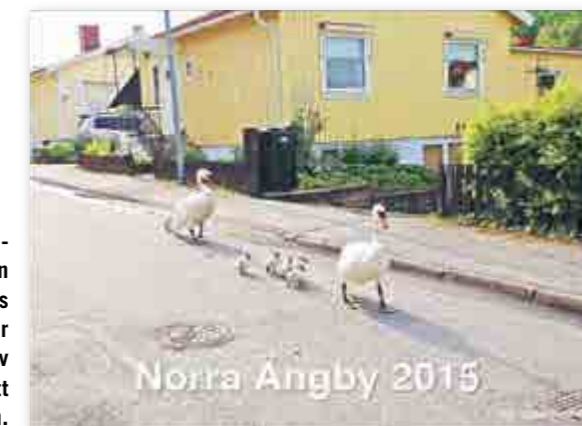
Omslagsbilden till årets kalender togs av Sol-Britt Svensson.