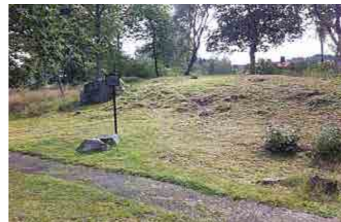
Runsa borg låg på en ö längs vattenleden från nuvarande Uppsala till Mälaren. Där höll dåtidens elit till. Förmodligen var även platåhuset i Karsvik (bilden) med sitt höga läge en plats för stormän.

Det är spännande att fundera över vilka som en gång bodde på platåhuset i Karsvik och vad detta hade för roll en gång i tiden. Också den hallen ligger högt placerad med i forntiden fin utsikt över omgivningen. Den stormannen kunde alltså kontrollera vad som skedde i dalen söderut där i början av första årtusendet låg en stor sjö med vissa kvarvarande rester även under vikingatid. Platåhuset kan på sätt och vis också kallas för en