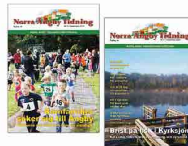
Norra Ängby Tidning kom ut med fyra nummer.