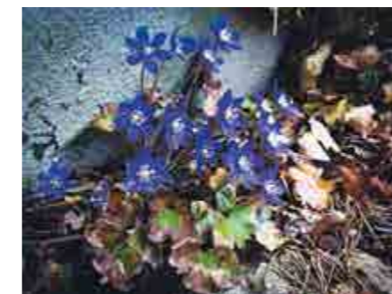
Blåsipporna växer mellan mur och stentrappa.