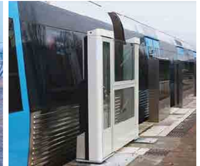
Flera olika typer av plattformsdörrar har testats. När tåget står stilla vid perrongen öppnas plattformsdörrarna.