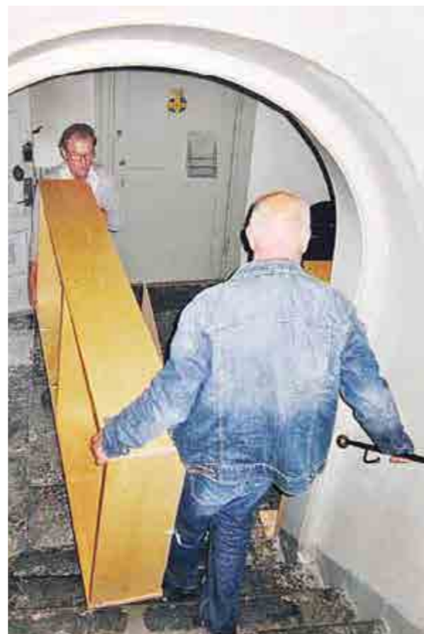
Trädgårdsstadsföreningen måste flytta sitt lager från slottets vind.