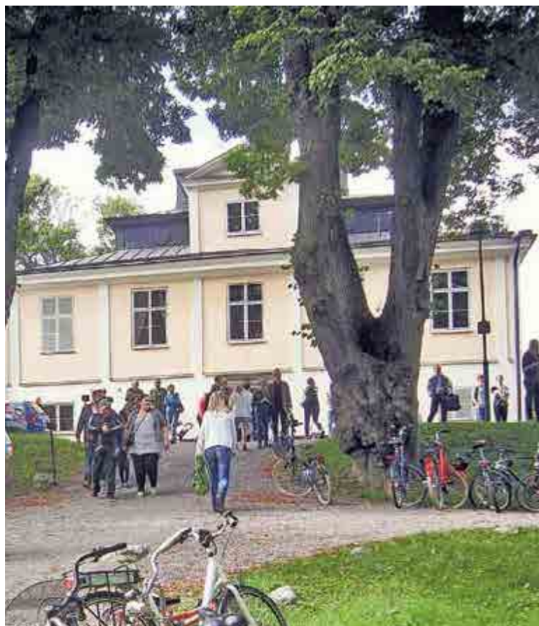
Slottets tömdes på hyresgäster och inredning. Sista söndagen i augusti såldes lösöre ut.