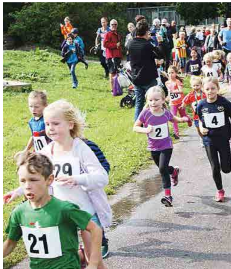
Ängbyloppet lockade massor av löpsugna barn och hejande föräldrar till Björklunds hage. Det var några år sedan loppet sprangs senast.