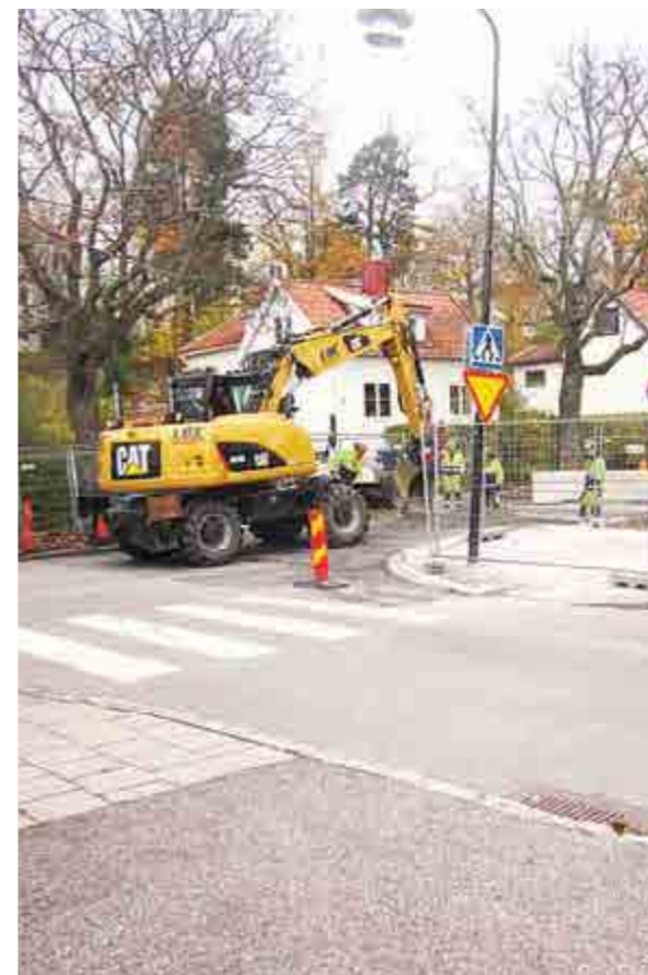
Efter många turer kom äntligen arbetet igång med att göra barnens skolväg säkrare..