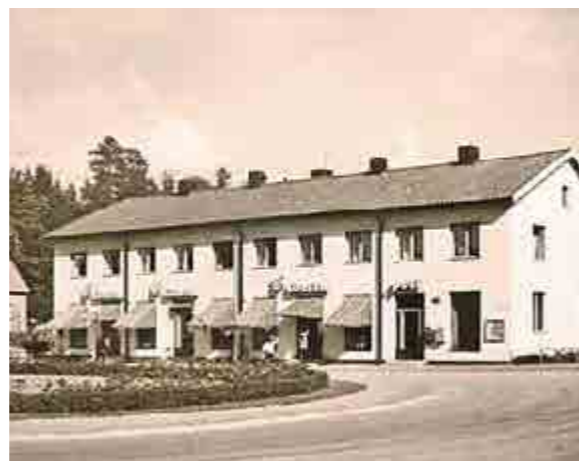
I skriften från 1937 finns annonser för elva butiker vid Ängby torg. Torget var centrum, där träffade man "hela Ängby", utbytte senaste nytt och skvallrade lite med postfröknarna, som var kunskapscentraler rörande livet i Ängby.