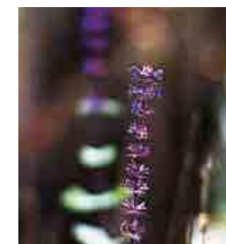
Salvia, här blommar den för andra gången på säsongen och tack vare att hösten var mild så stod den sig länge. Fotot är taget i mitten av december.