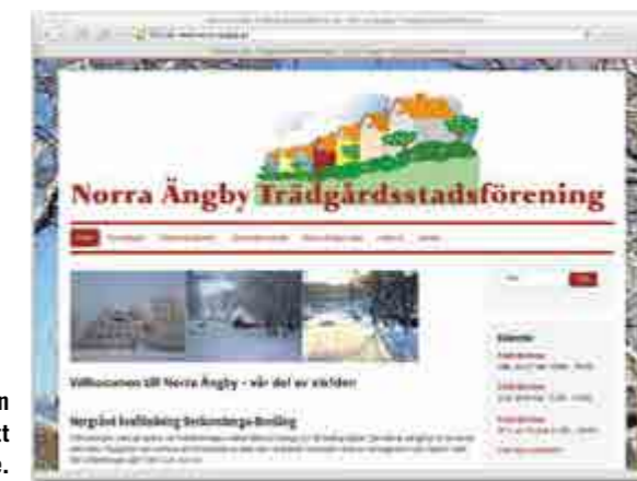
Hemsidan fick nytt utseende.