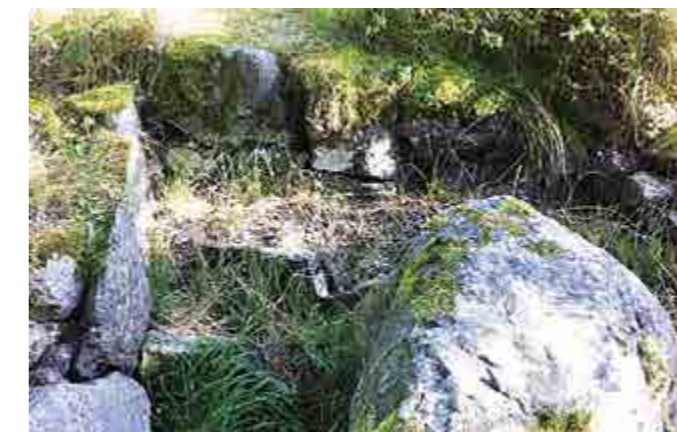
I Runsa borg finns ett vattenhål med ett stort stenblock nedvält i, förmodligen av rituella skäl. Precis som i den uttorkade källan i Linta med blocket i mitten (bilden).

höjdbosättning för en elit. Läget var strategiskt. Ibland undrar jag om den trågvärn som påträffats vid grävning på en tomt på Beckombergavägen inte långt från platåhuset kan ha samband med platåhuset eller om den är från senare period (se mina artiklar i NÄT 2006:4 och 2008:1).