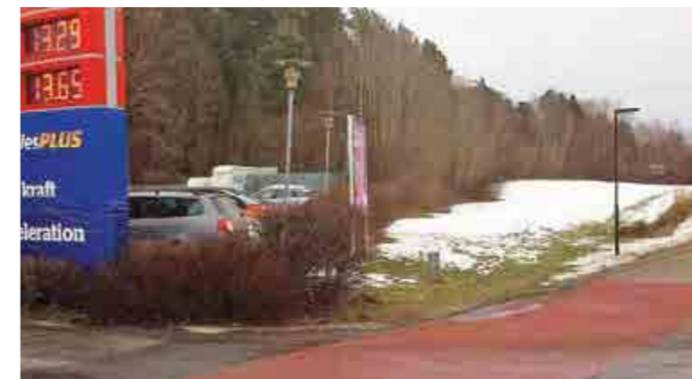
Trädgårdsstadsföreningen har haft synpunkter på planerade byggen vid Ängbytvätten och vid ängen före Runstensrondellen.

► med fyra nummer. Tidningen är en del i föreningens strävan att medverka till en positiv utveckling av trafik, service, nybyggnation med mera.