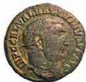
Har de romerska mynten tagits hem av krigare som varit legionär i romerska hären?

Den stora hallen i Runsa spelade en central roll i det dåtida livet. Husterassen är 38 meter lång och 12 meter bred. Ungefär 270 kvadratmeter av hallens yta har undersökts vilket motsvarar mellan 90 och 95 procent