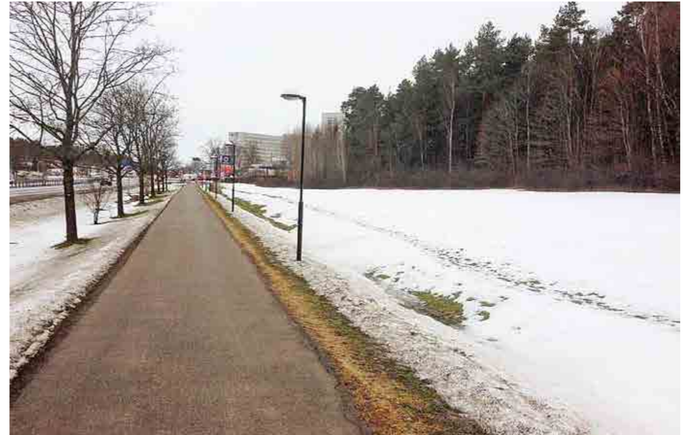
På ängen mellan slutet av lokala Bergslagsvägen och Statoilmacken vid Räckstarondellen ska byggas tre bostadshus med sammanlagt 130 minilägenheter på 32 kvadratmeter, så kallade snabba hus.