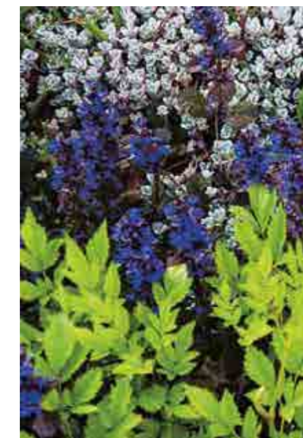
Marktäckaren Revsuga blommar under försommaren vackert och väver ihop sig med en Astilbe som kommer att blomma långt senare.