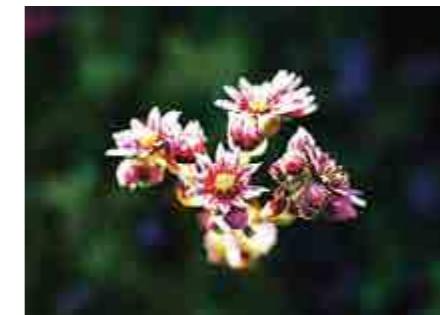
Taklöken blommar på sina höga stänglar under juni och juli.