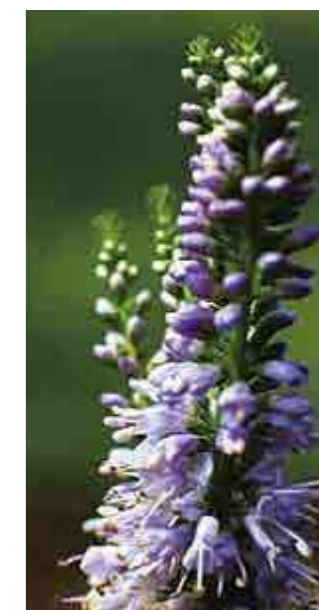
Veronika heter denna fina perenn som blommar under augusti.