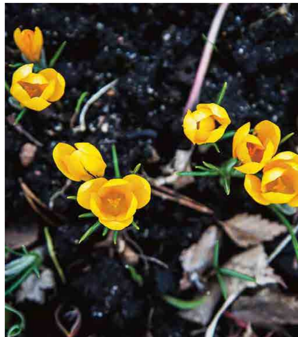
Gula krokusar – lyser som solar i rabatten.