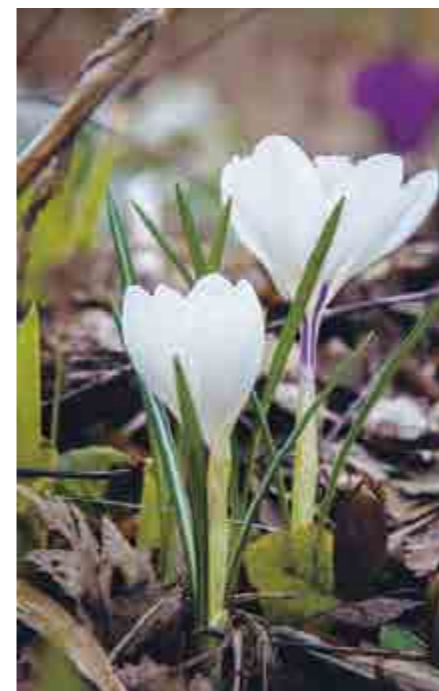
Några av årets första blommor, krokusarna spränger upp genom lövtäcket.