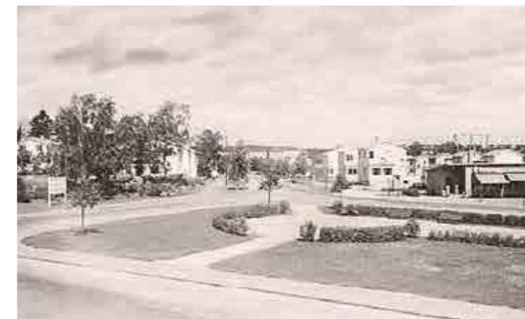
Fyra annonsörer hade verksamhet vid Runstensplan, bland annat Konsum i nuvarande Nords fastighet.

Vid Runstensplan fanns även Konsum i nuvarande Nords fastighet med tre butiker: mjölk, speceri och charkuteri. Konsum hade dessutom en