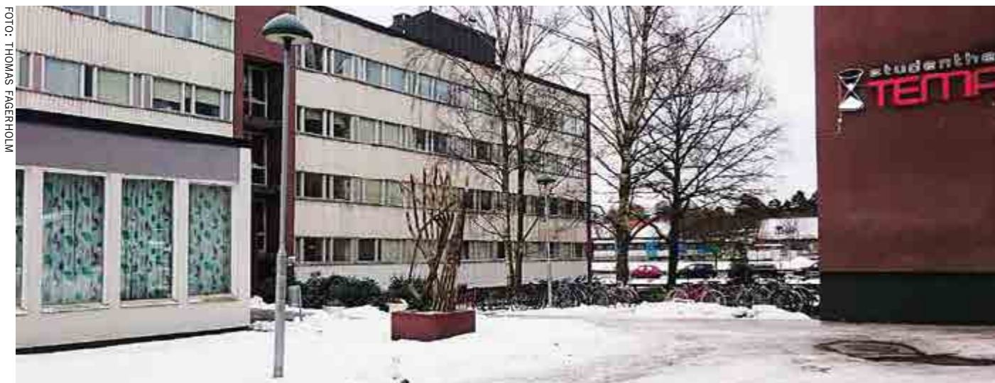
Årsmötet hålls den här gången i studenthemmet Tempus samlingslokal, alldeles i början av Beckombergavägen.

Medlemmar i Norra Ängby Trädgårdsstadsförening hälsas välkomna