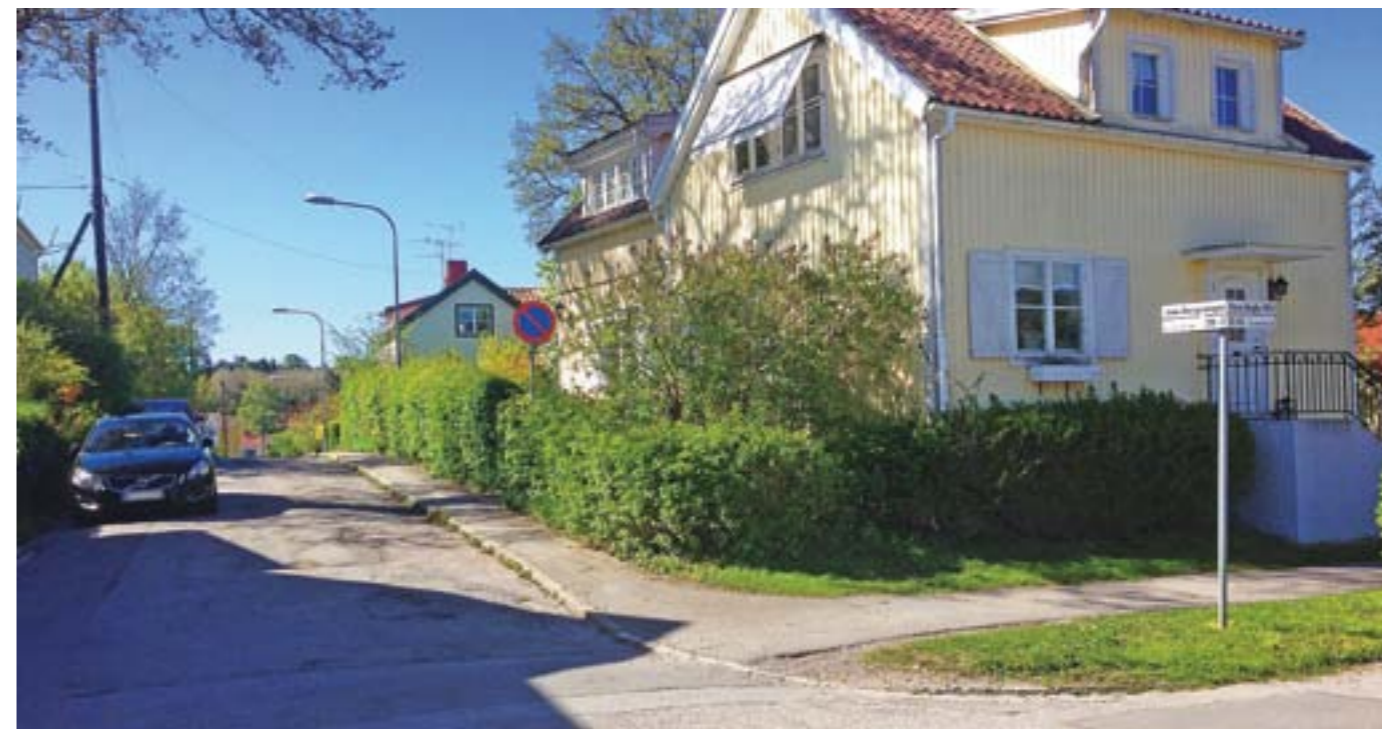
Jomsborg är ett annat namn på staden Jumne som egentligen hette Wollin under vikingatiden. På bilden syns Jomsborgsvägens infart från Stora Ängby Allé

Kanske har graven anlagts av ett begravningsfölje som anlant i båt till den dåtida ön i det skärgårdslandskap som Norra Ängby var en del av?