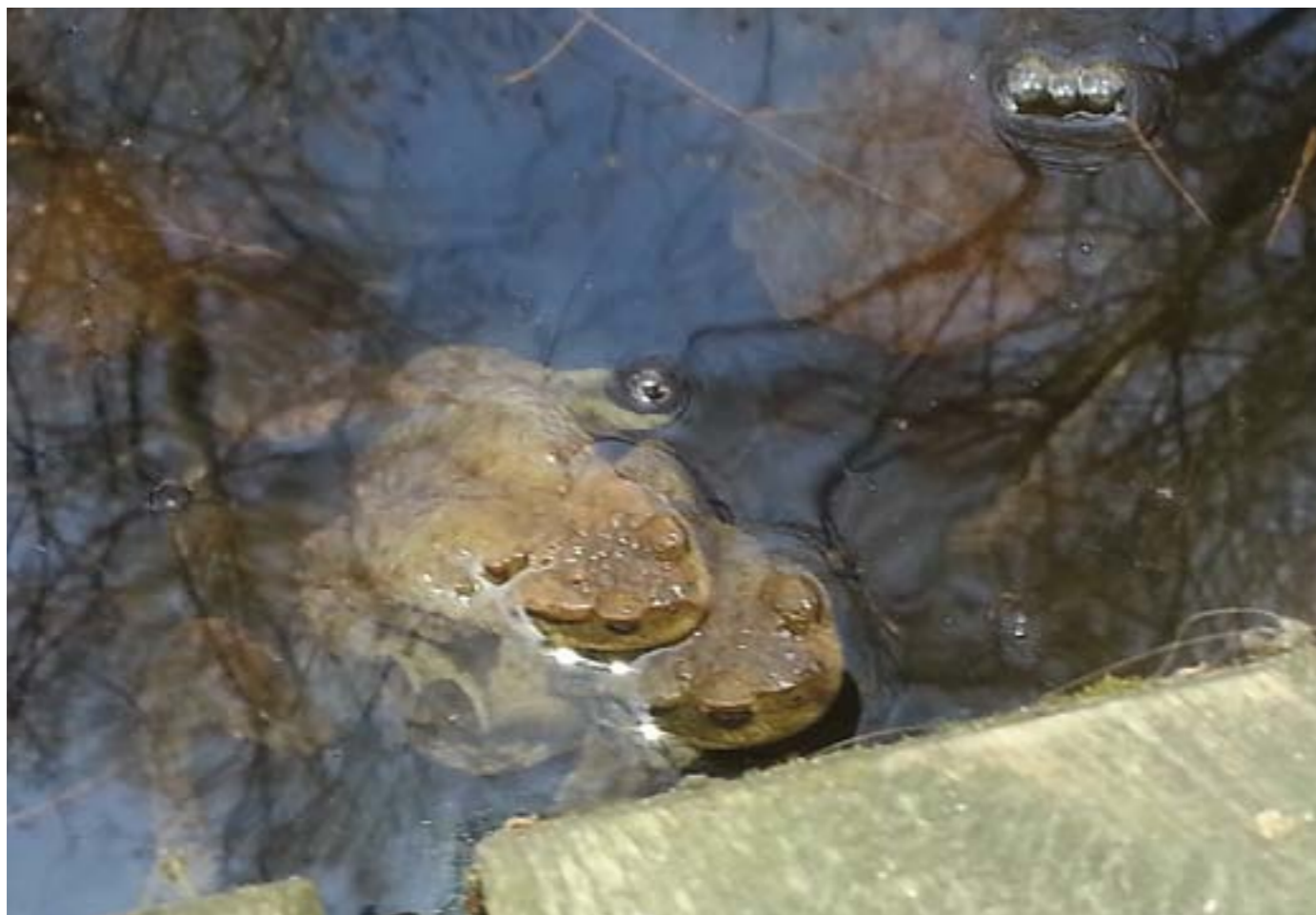
Calle Kettisen tycker om att fotografera vad han ser i naturen och de här två grodorna som parade sig upptäckte han vid Kyrksjön.