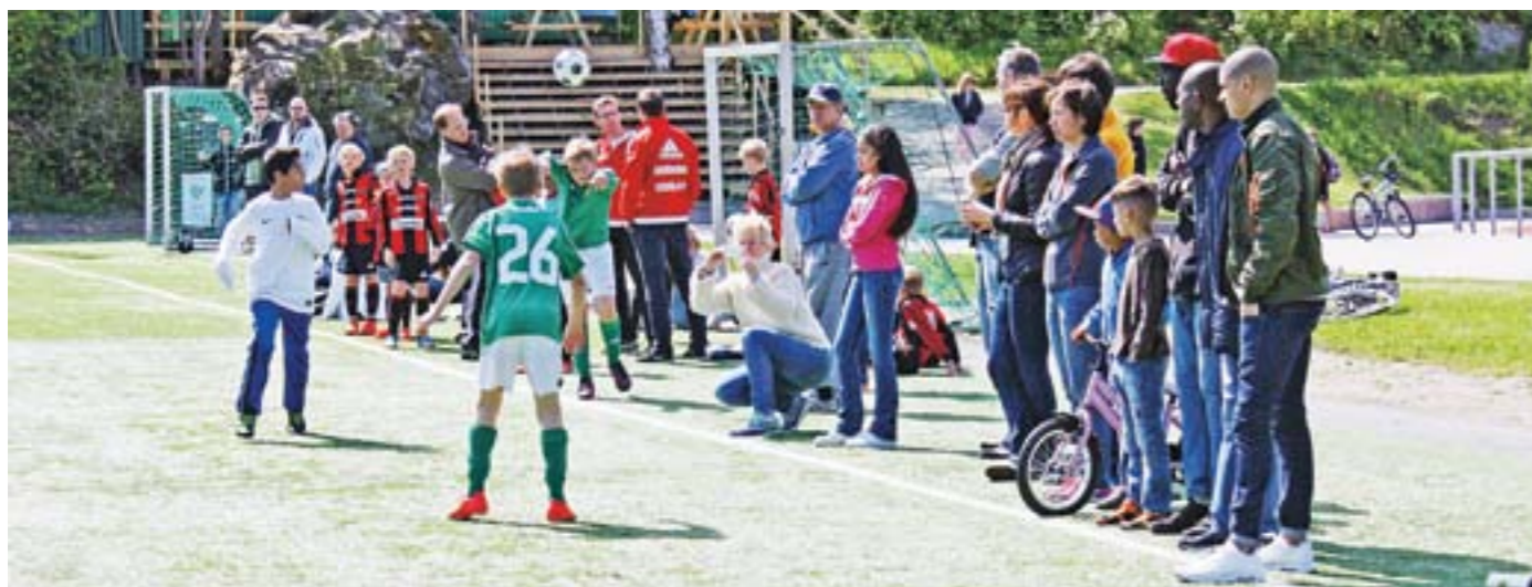
Att stå vid sidan av planen när barnen spelar är spännande. Här träffar man nya vänner och många föräldrar engagerar sig också som ledare eller tränare. Mer än hälften av alla Ängbybor deltar i någon form av ideell verksamhet.

– Ungdomar söker nya vägar och har mycket av sin er-