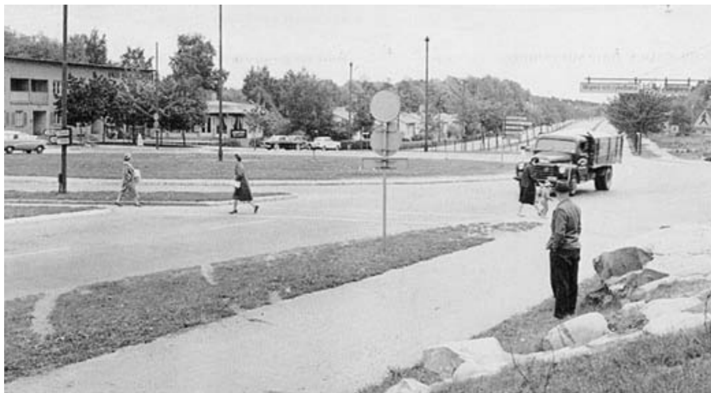
Förr fanns det en rondell i korsningen vid Islandstorget. I dag är det trafikljus. I bakgrunden ses affärslängan och Runda huset där det genom åren funnits olika verksamheter; konditori, skivstudio, lampaffär och i dag en fastighetsmäklare.