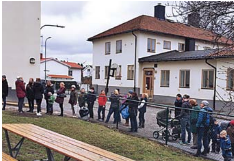
Mängder av kunder fyndade under några hektiska timmar.