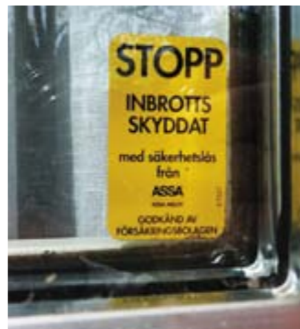
Bovarna lyckades inte ta sig in medan vi sov. Det kan vi nog tacka fönsterlåsen för.