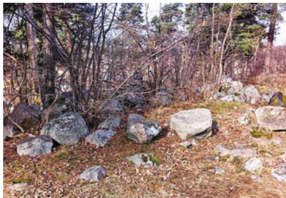
Bronsåldersgraven på krönet av berget i kvarteret Stensättningen.

På höjden intill Jomsborgsvägen ligger RAÄ 65. Det är ett litet gravfält med ett par stora stensättningar. I slutningen ner mot vägen har jag också sett en rund stensättning i snåren. Finns det ett samband mellan