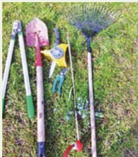
Bra trädgårdsverktyg underlättar och Rotvattnaren är oundgänglig.

Om jag vill få en snabb lösning, får jag anlägga en ny gräsmatta. Alternativet som tar betydligt längre tid, är att gödsla och vattna gräsmattan så att gräset konkurrerar ut mossan. En grundregel för årligt gödning av