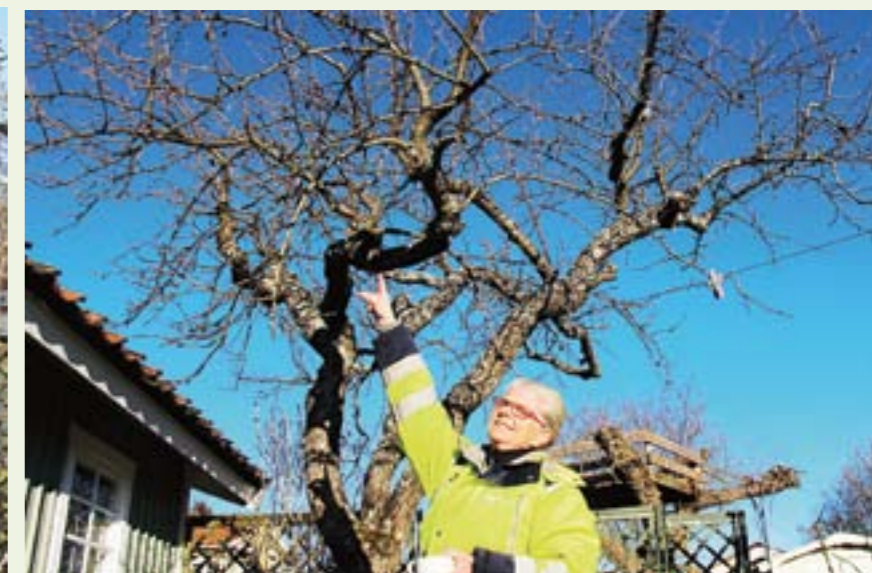
Stenfruktträd, som plommon, skall inte beskäras alls på våren.