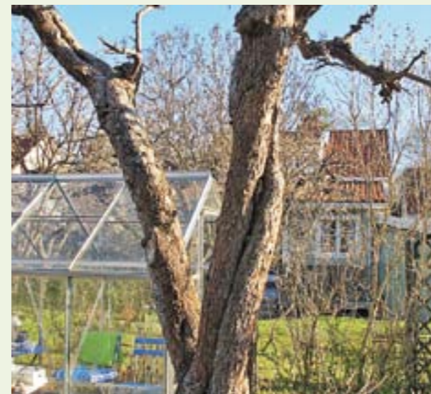
Bara en tredjedel i äppelträdet ska beskäras. Kapar man alla vattenskott börjar trädet att vrida sig.

För lite mer fritidshus tomt som sällan blir klippt väljer man rödsvingel, hårdsvingel samt rödven.