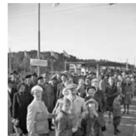
Där tunnelbanestationen Islandstorget nu ligger låg spårvägsändhållplatsen, som invigdes 1944. Där vände linje 11, Ängbybanan.

I undre planet av nuvarande Bjurfors har funnits Öbergs Möbler