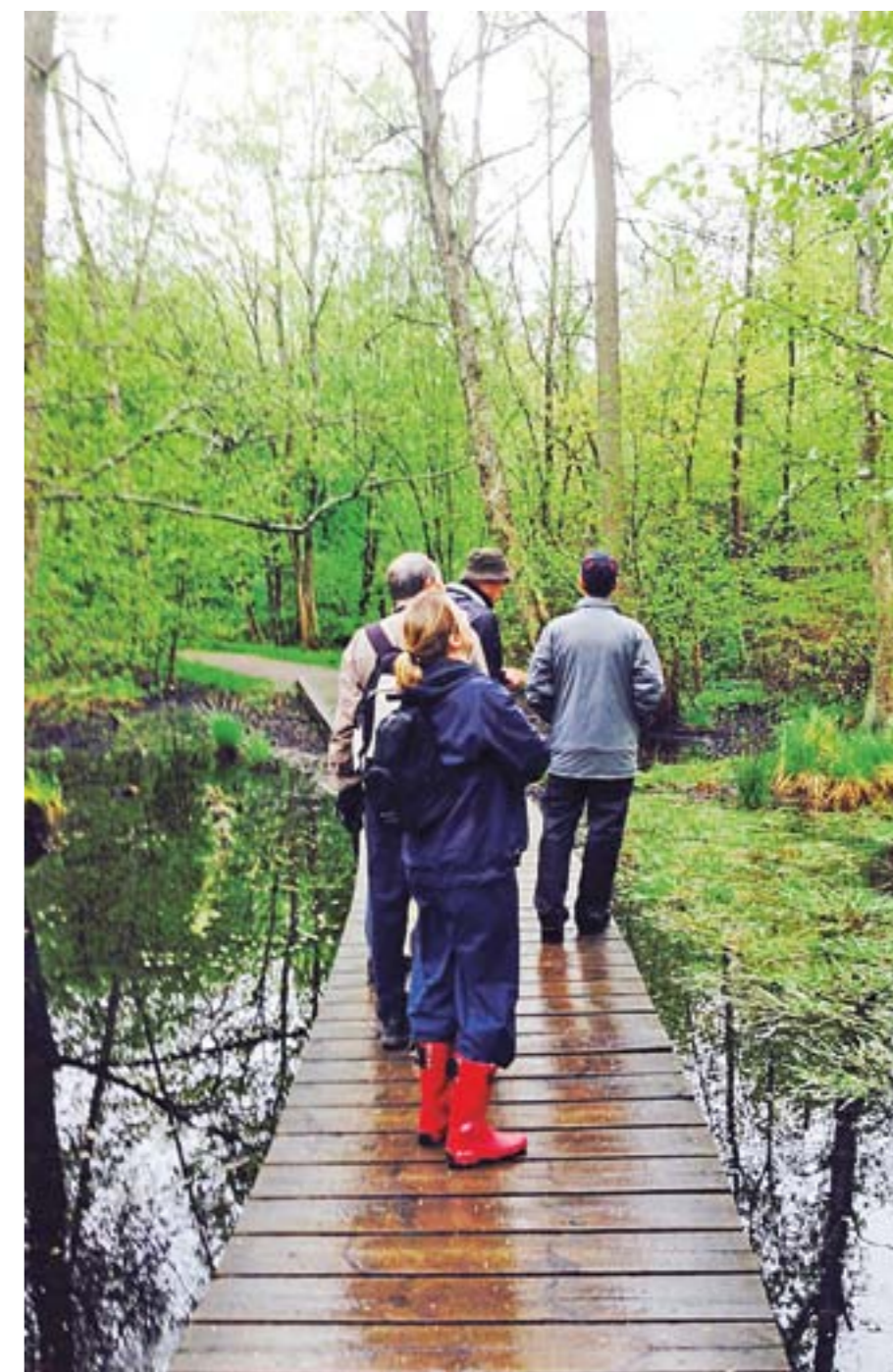
Både i Judarn och vid Kyrksjön hörde vi den underbara näktegalens kluckande skönsång.

fågelskådare, Vigg, Sothöna, Gräsand och den tjusiga Rödhakedoppingen. Nu får vi också se Gökottans första rovfågel. En sparvhök som blir jagad av två svalor. Anfall är bästa försvar.