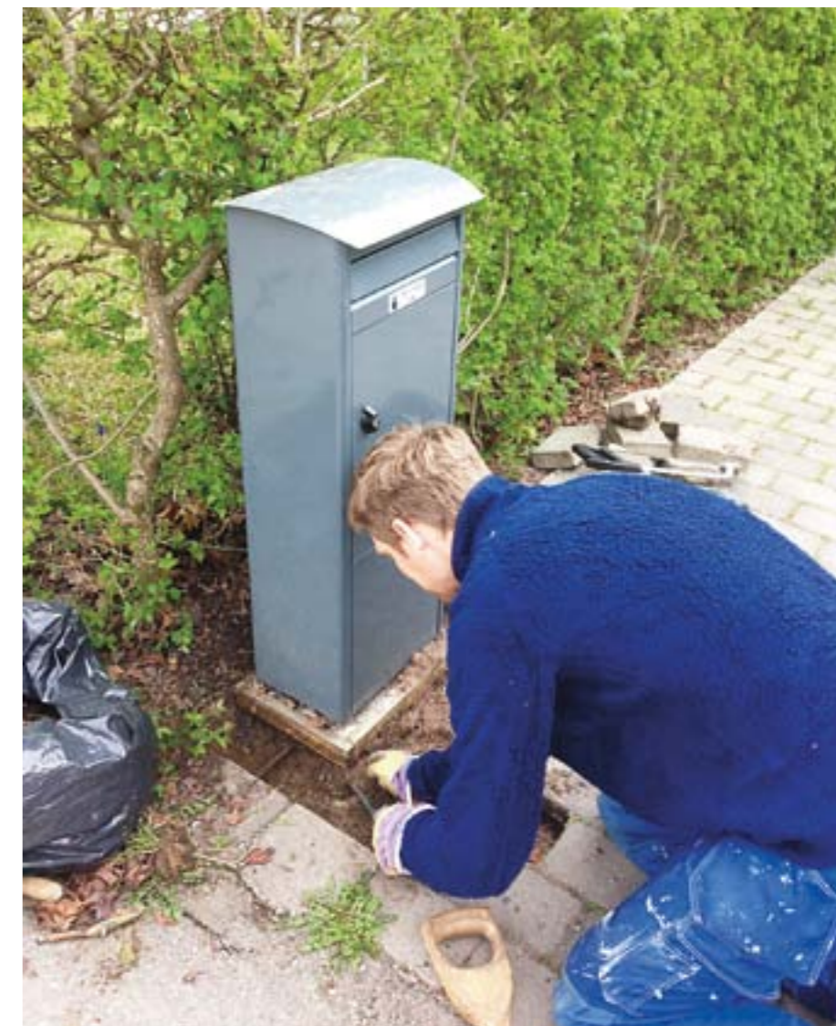
Postlådan måste vridas så att den står vid tomtragransen med inkastet vänt ut mot gatan. Posten har inspekterat alla lådor i Norra Ängby och skickat en uppmaning till dem som måste flytta eller vrida lådan.