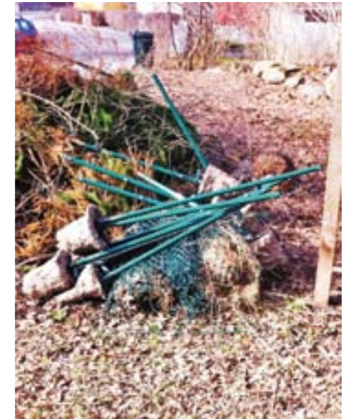
Bilderna visar resultatet – dels den fina raden av vårdade högar men nu utan staket, dels det nedplockade staketet vid rishög intill Runsavägen.