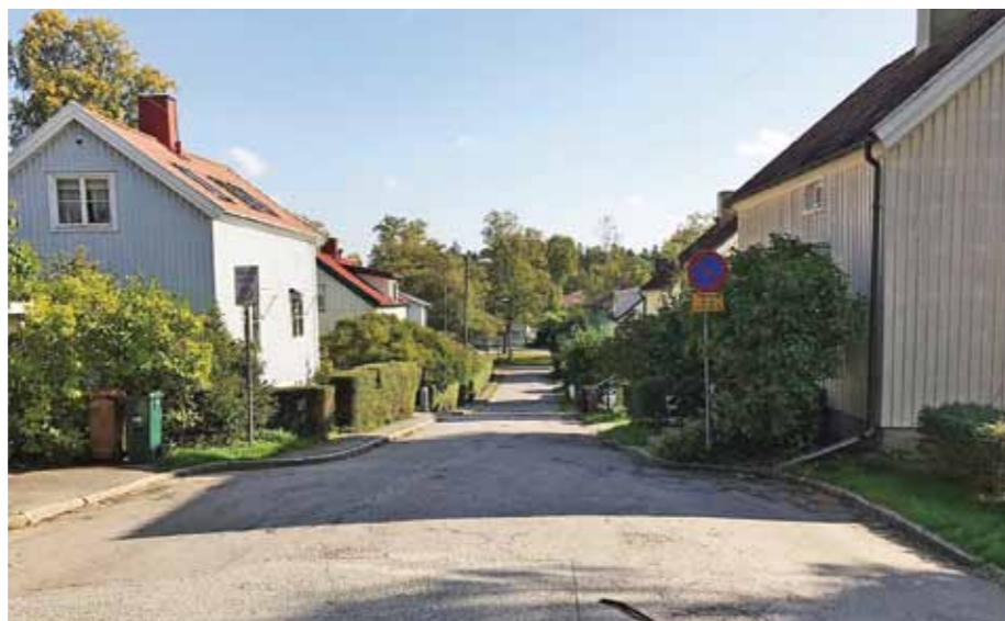
Jordanesvägen slutar där Karsvikshage börjar. Jordanes var biskop i Ravenna. Han skall ha dött som munk i Italien.

Jordanes var biskop i Ravenna. Han skall ha dött som munk i Italien. I sin berättelse om goterna beskriver Jordanes ön Scandza som stor och folkrik och kallar den för "folkens vagga eller i varje fall nationernas modersköte". Utvandringen skall ha skett med tre skepp. Jordanes källor var äldre och yngre itinerarier (vägbeskrivningar). De skall ha meddelats av köpmän och krigare. På sådana muntliga uppgifter byggde i hög grad äldre tiders historieskrivare och geografier sina skildringar av länder och folk. Historieskrivarna kunde inte själva besöka alla länder så köpmän med flera var tidens upptäckare. De