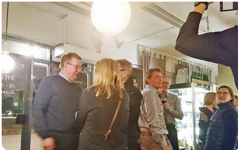
Klockan 23 strålade slutligen alla deltagarna samman på restaurangen vid Islandstorget.