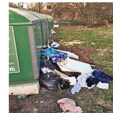
Nedskräpningen runt en återvinningsstation kunde ha blivit negativ för barnen på förskolan och djuren i Kyrksjölöten.

Många grannar protesterade mot förslaget och Trädgårdsstadsföreningen skrev ett brev till stadsbyggnadskon-