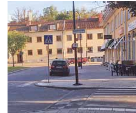
Samling vid torget kl 21 fredag- och lördagkvällar.

Sedan förra sommaren då kvällsvandringarna drogs igång på frivillig basis har det bara varit uppskattande kommentarer från de ungdomar vi har mött ute. Det känns lite tryggare att det finns vuxna ute för att se till alla har det bra. Samt att det är lärorikt att se vad som egentligen händer