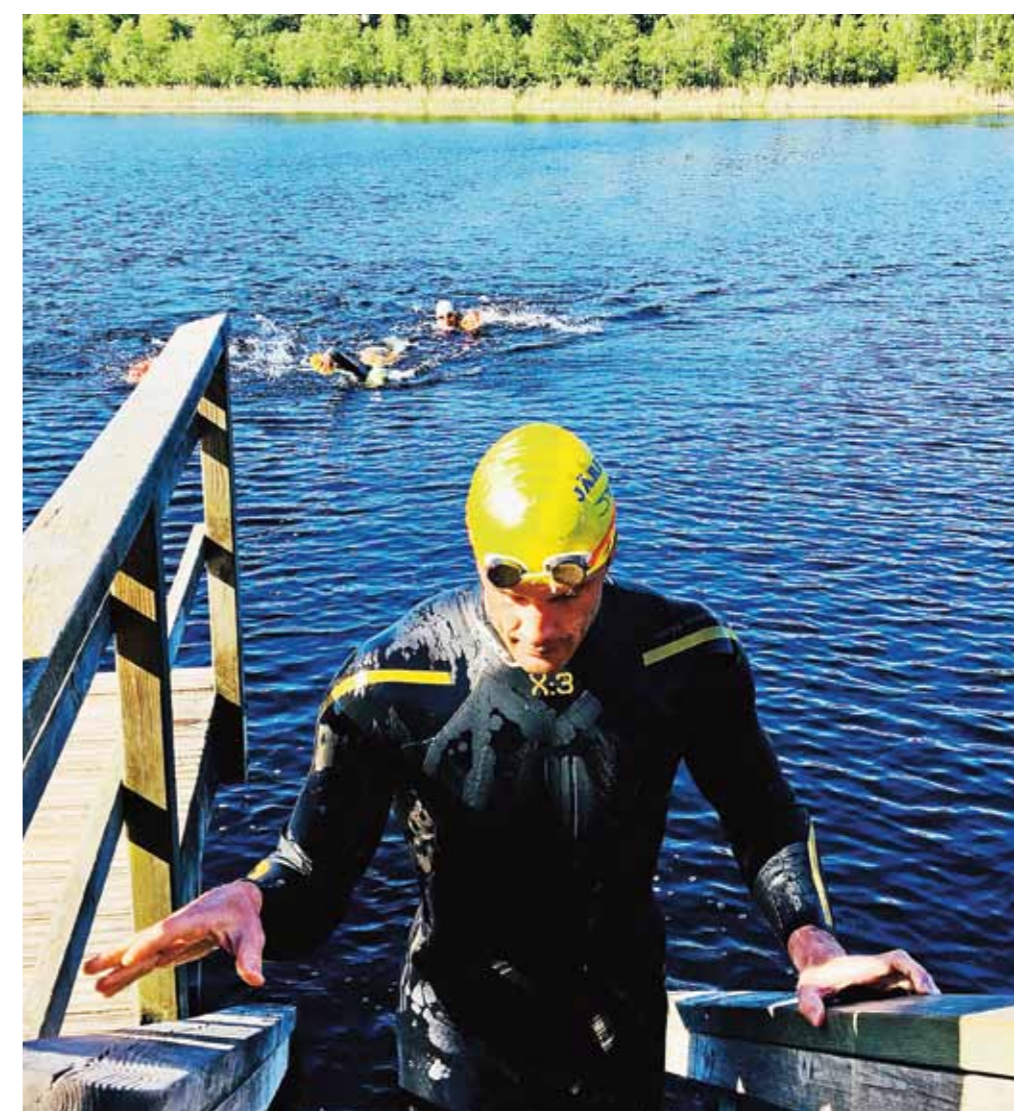
Doppingen hade fullt sjå med att undvika grabbarna som tränade för Swim&Run.