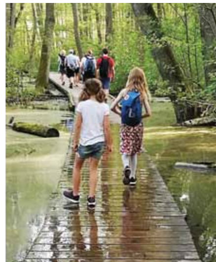
Det var första gången Trädgårdsstadsföreningen ordnade fågelskådning speciellt för barn.

Mälarscouternas avdelning med insektsnamn (trollsländor, myggor och myror) kom också. Då var hela bryggan full med barn och vuxna. Vi såg tusentals grodyngel och en igel som simmade vid bryggan. På väg tillbaka