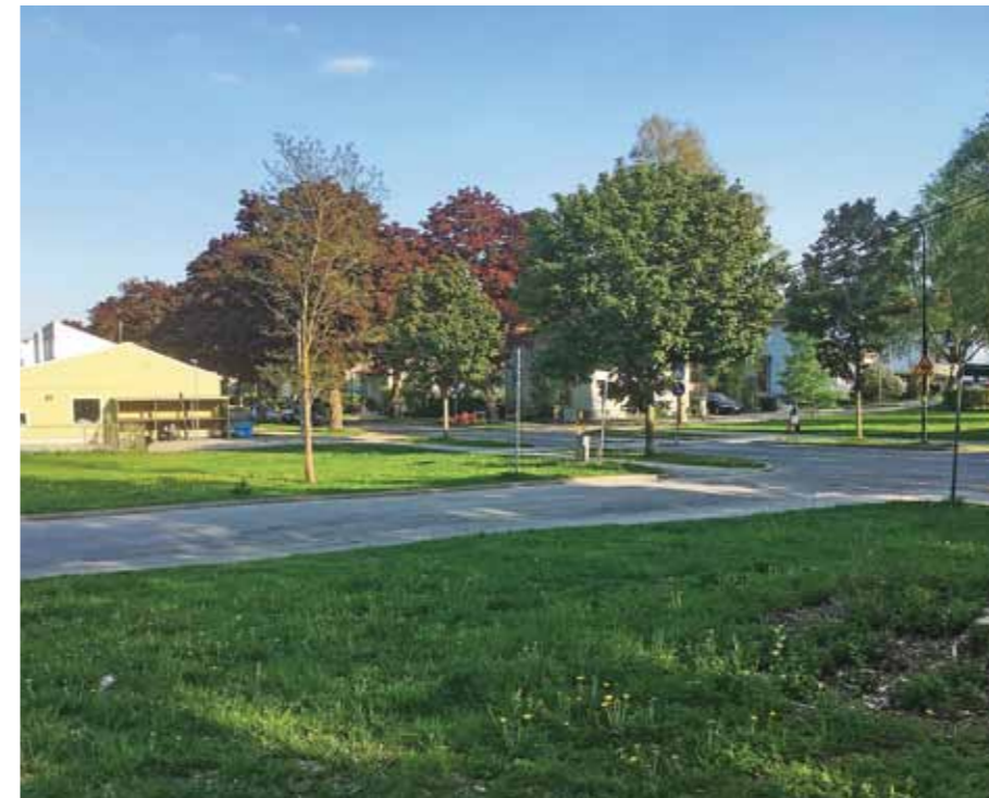
Även stadsbyggnadsnämnden anser att Hörnet Beckombergavägen-Snorrevägen är en illa vald plats för en ny återvinningsstation. Nämnden avslag ansökan om bygglov.