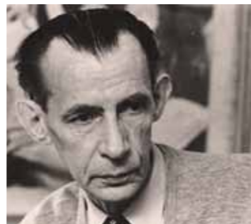
Några av Nils Ferlins tonsatta dikter är "En valsmelodi", "När sköheten kom till byn", "Får jag lämna några blommar", "En liten konstnär", "På Arendorff's tid" med flera.