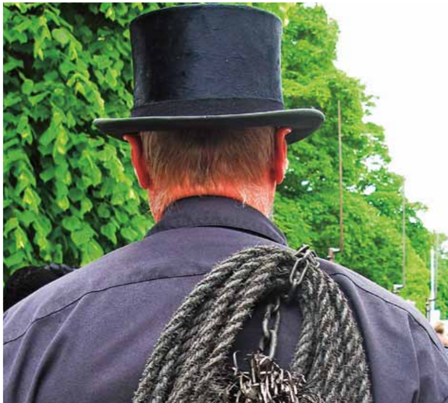
Du kan själv välja att använda en egenvald auktoriserad firma för sotning men då är du inte garanterad den av Storstockholms brandförsvaret överenskomna taxan.

Du kan själv välja att använda en egenvald auktoriserad firma för sotning men då är du inte garanterad den av Storstockholms brandförsvaret överenskomna taxan. Att göra ett eget val innebär att du måste fylla i blanketter som ska skickas in till brandförsvaret och få det godkänt.