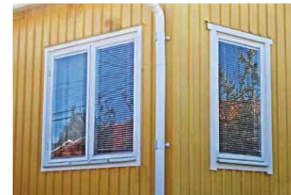
Originalfönster med vitt foder.

Den Ängby-detalj vi väljer att beskriva denna gång är att fönster, som liksom ytterdörrar är en mycket synlig och påtaglig detalj som spelar stor roll för Ängby-stilen. Fönsterbågarna är smäckra och utvändiga foder smala och utan att någon av fodrens delar sticker ut i hörnen. I bild 1 ser man tydligt att det högra fönstret är ett nutida till-