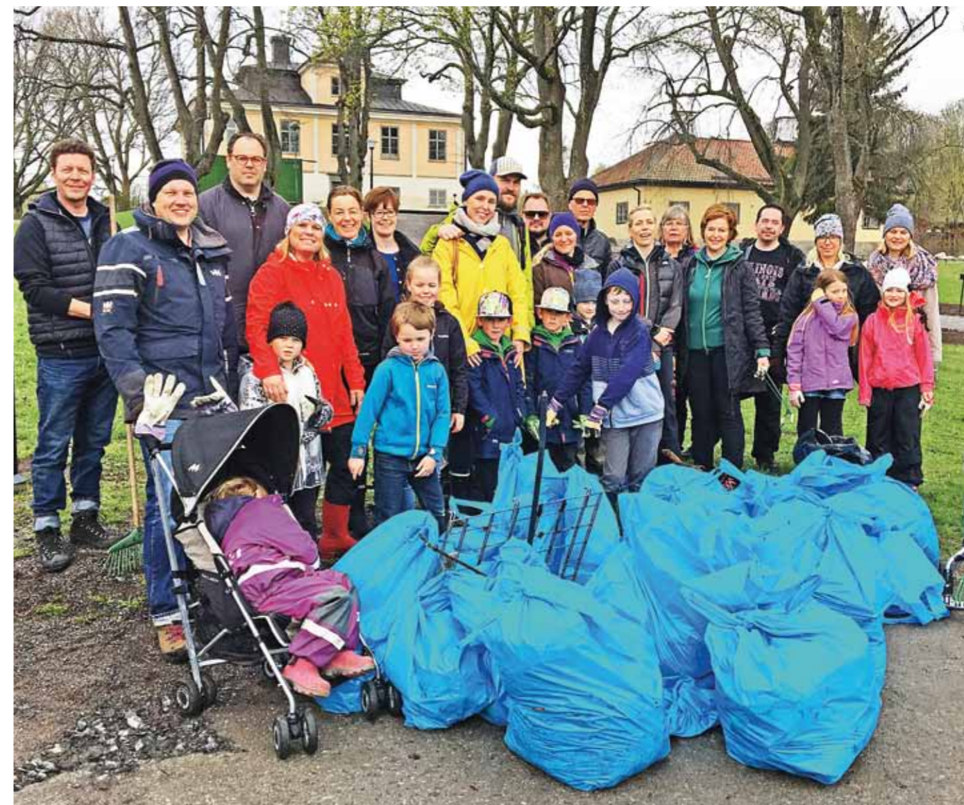
Sedan samlades alla fyllda skräpsäckar ihop för borttransport och samlarna fick varmkorv och fika i Björkan.