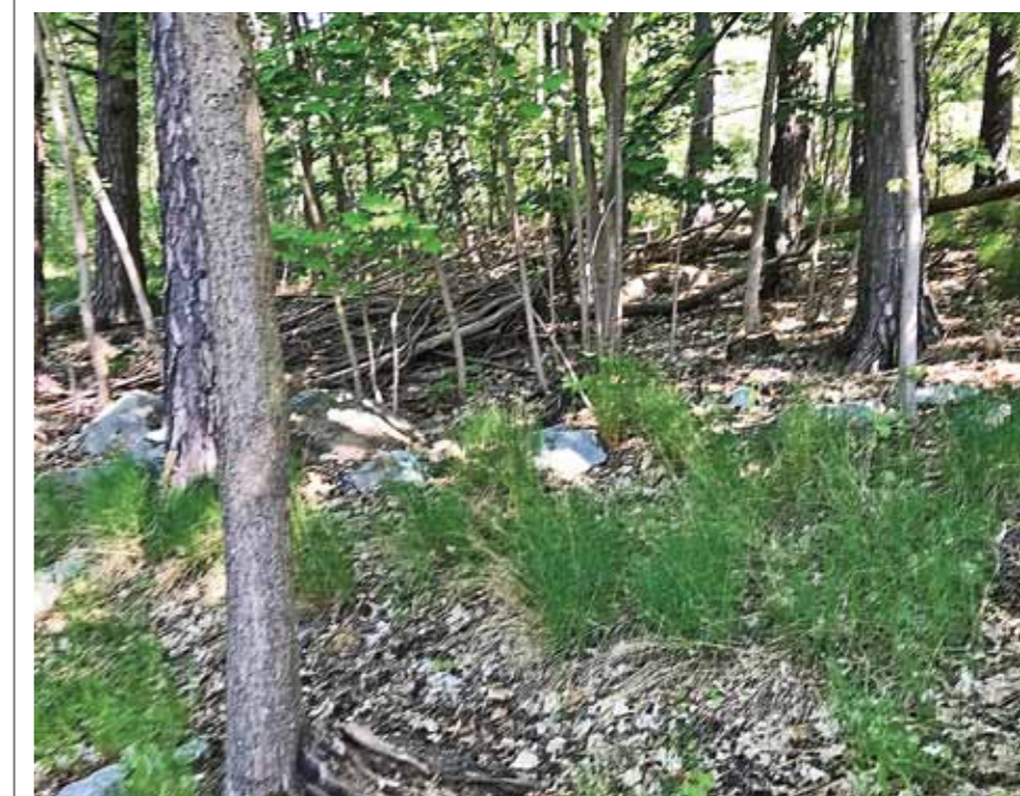
Stensträngarna ligger intill Bureusvägen. I förlängningen av Brennervägen finns en stig upp i Komötet.

För att se om här fanns mer i skogen fortsatte jag lite längre uppför backen och fann ytterligare en tidigare okänd stensträng cirka 16 meter lång (se foto). Strax väster om stensträngen syns en av de högar som hör till gravfält 63 i Komötet. Detta gravfält har ett tjugotal gravar, bland annat den stora högen öster om Liljegrens-vägen. Komötets äldre gravar och de två yngre järnåldersgravfälten nämns på skylten som står nära Liljegrens-vägen.