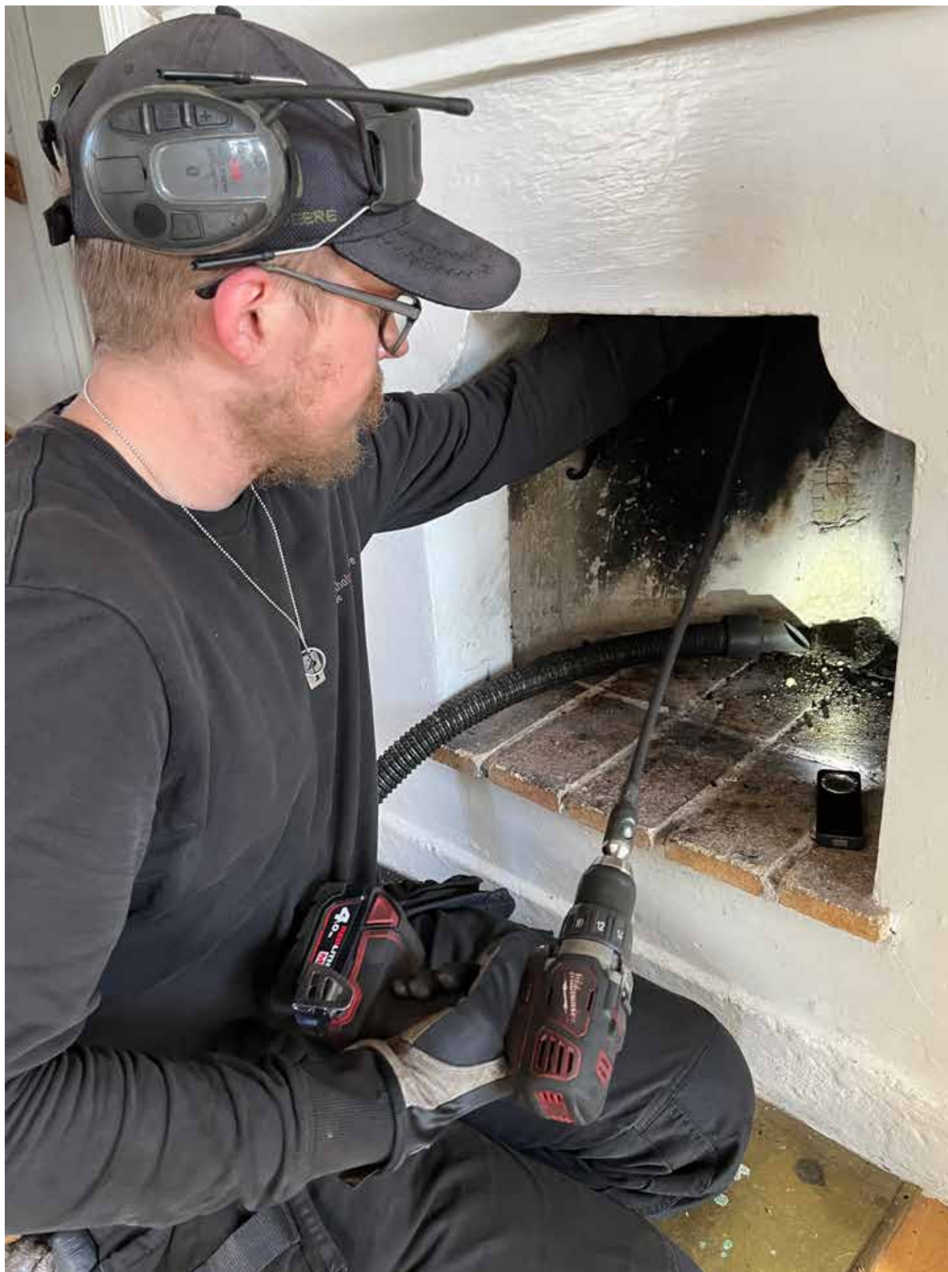
Sotningen sker numera helt inifrån huset. Sotaren fogar samman stavarna som vore det ett långt fiskespö. På översta staven finns en borste. Sedan snurrar stavarna inne i rökkanalen med hjälp av skruvdragare. Sot som faller ner sugts upp i dammsugaren.