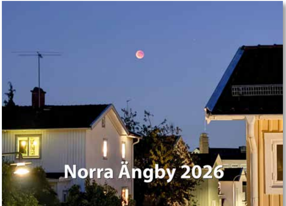
Bilderna i Ängbykalendern 2026 är tagna och utvalda av medlemmar i Norra Ängbys fotogrupp.

Sedan dess har fotograferna utvecklats till en aktiv gemenskap som både arrangerar utbildningar och genomför tävlingar med olika teman. Gruppen bygger helt och hållet på en Facebook-grupp som är öppen för alla Norra Ängbybor som har