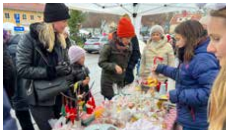
Godis och fika.