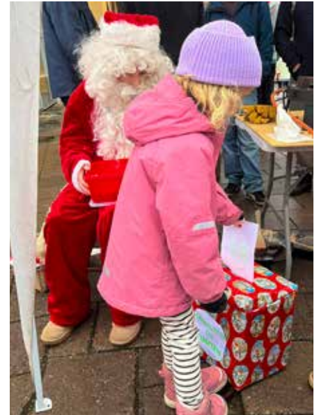
Det kom in 71 listor till tomten, med önskan om allt från fred på jorden till ett hus i Spanien!