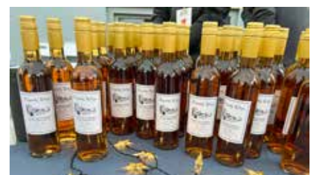
Föreningen sålde årets Engiaby Glögg.