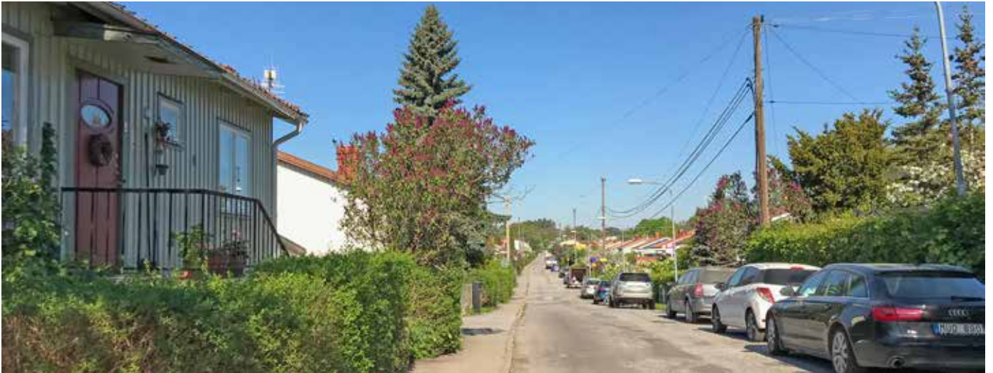
Richard Dybecks text till den svenska nationalsången inleddes ursprungligen med raden "Du gamla, du friska". Dybecksvägen går från Frislandsvägen till Vultejusvägen.