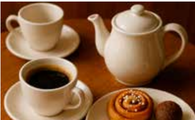
Träffa styrelsen och grannar. Vi bjuder på fika

Om du har synpunkter på det vi gör och inte gör eller rentav har ett skarpt förslag, det som brukar kallas motion , är du välkommen att höra av dig till info@norra-angby.se eller någon annan i styrelsen före 31 januari. Mer information om årsmötet kommer i nästa nummer av Norra Ängby Tidning. Du får den i din brevlåda i början av mars nästa år.