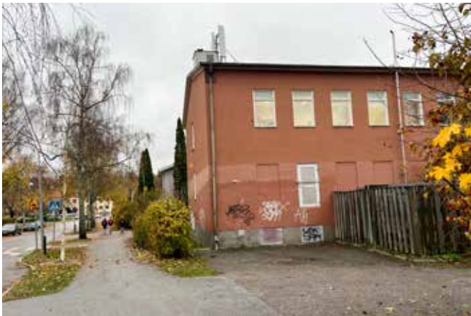
På övervåningen i det gamla Televerkshuset finns fyra konstnärsateljéer.