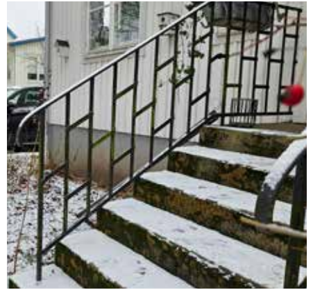
Det finns alla möjliga varianter, där man har brutit spjälornas regelbundenhet genom att förse vissa spjälor med en spets, genom att här och där bilda ruttmönster, fälla in husnumret etc, etc.

eller ibland tre tvärstag på andra ledden, dvs parallella med handledaren.