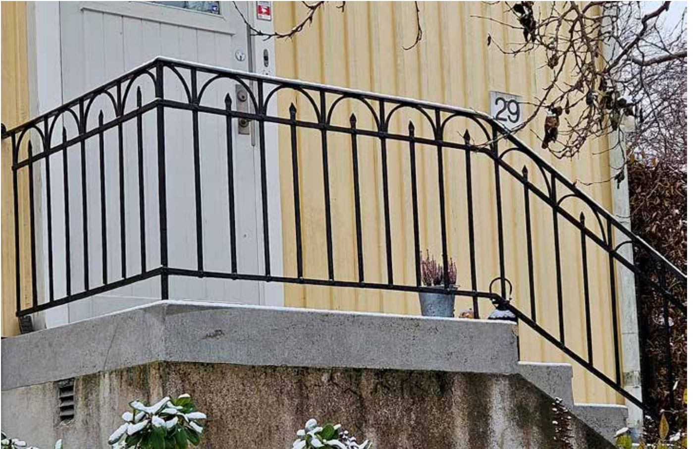
Gemensamt för de flesta hustyperna är att de har en entrétrappa i betong med smitt järnräcke. Det smidda trappräcket är ett fint hantverk.